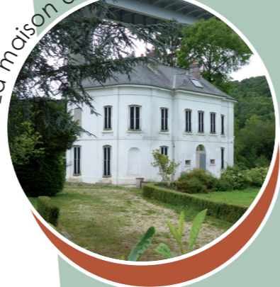
Détail de l'architecture