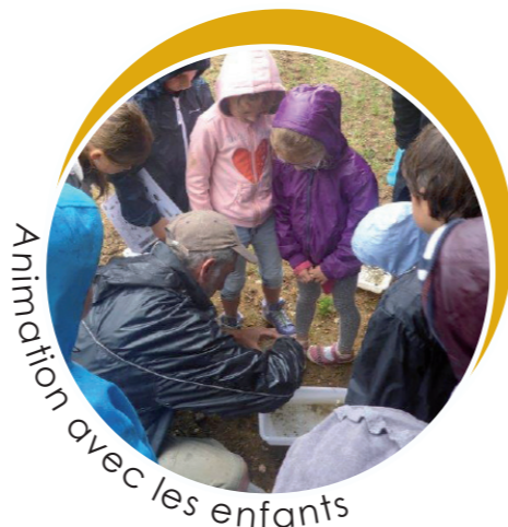
Animation avec les enfants

6 c'est le nombre d'écoles ayant bénéficié d'une animation