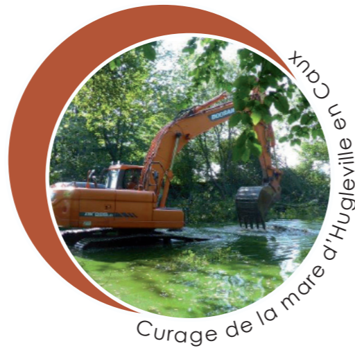
Curage de la mare d'Hugleville en Caux