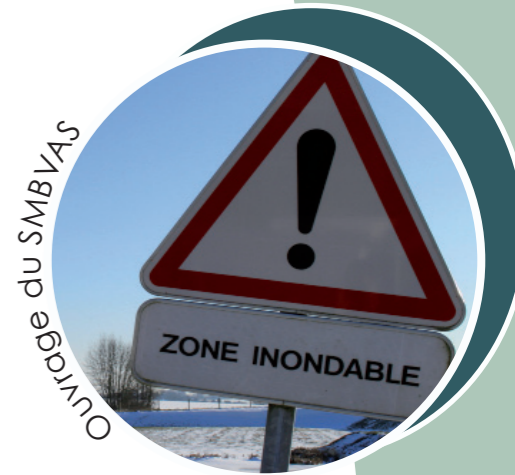
Curage du SMBVAS