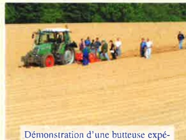
Démonstration d'une butteuse expérimentale sur pommes de terre

intermédiaires (avec la participation de l'Agence de l'Eau et du Département de Seine Maritime). Ainsi chaque année, de plus en plus de surfaces sont couvertes en hiver.