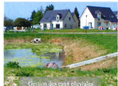
Gestion des eaux pluviales

Les aménagements doivent permettre de limiter les conséquences pour l'aval des projets.